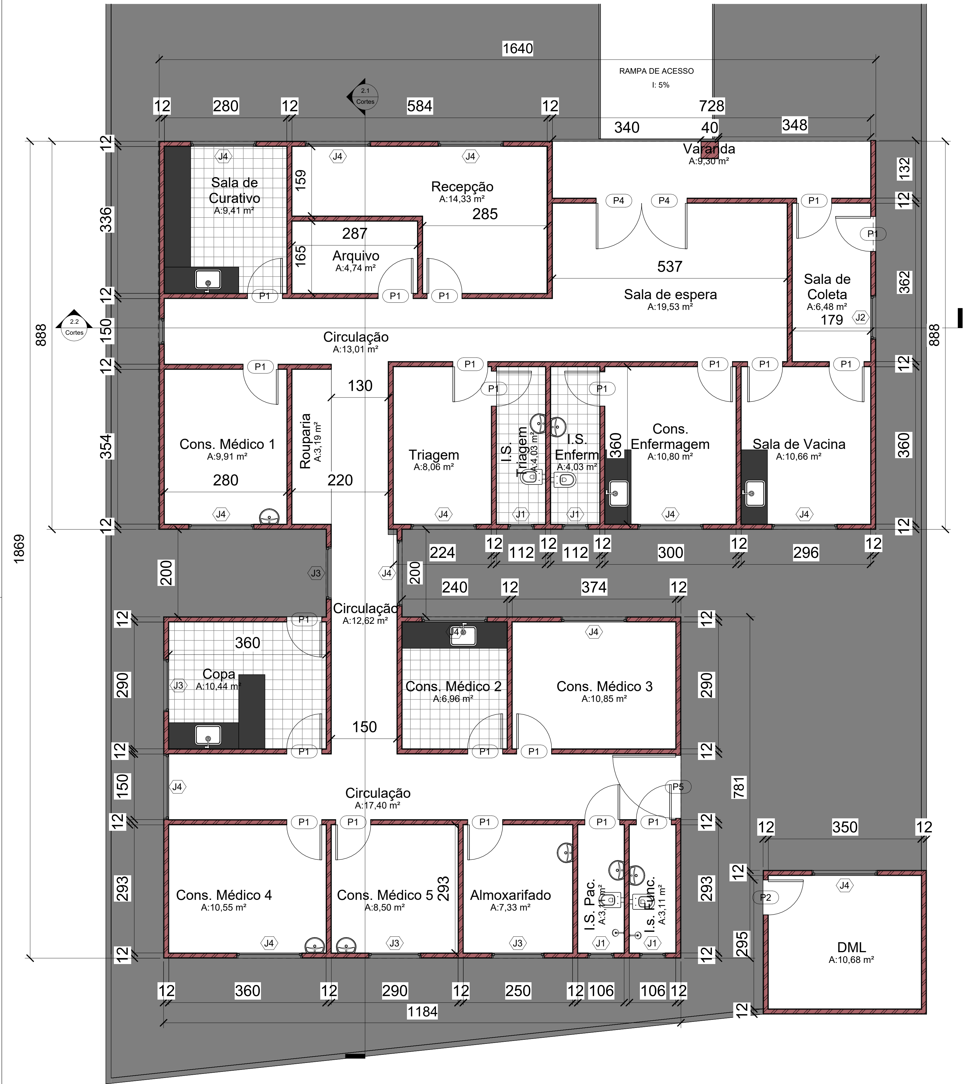
4 Planta Baixa 1 : 50